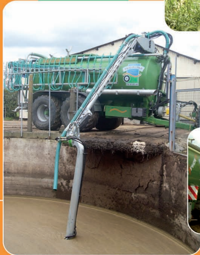
Bras supérieur TYPHON Pompage direct fosse (Profondeur 4,20m)