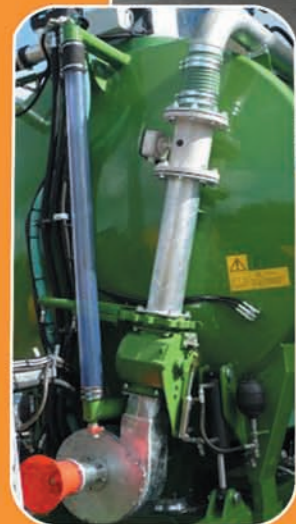
Turbine de vidange avec vanne 3 voies et débitmètre