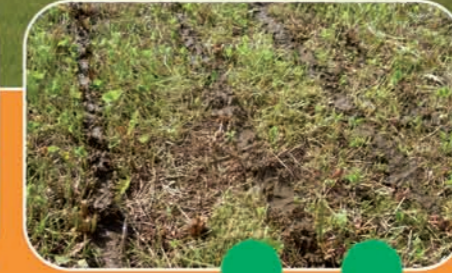
Rampe pendillards 15m, avec hacheur Vogelsang 48 sorties