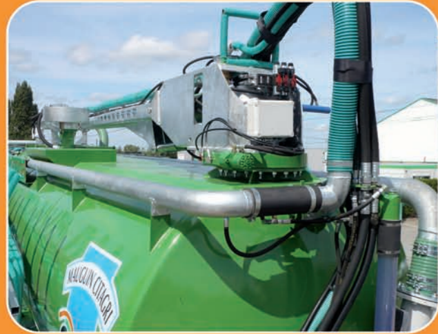
Bras tourelle Ø200 avec mise à l'air