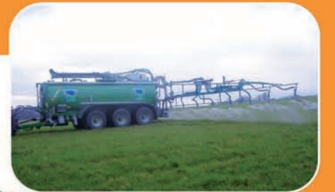
Rampe 24m, 16 jets, anti-goutte et correcteur de devers