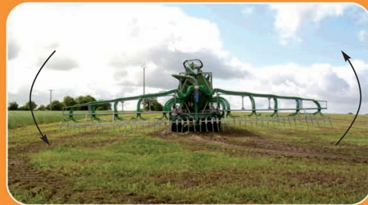
Correction de devers sur rampe pendillards