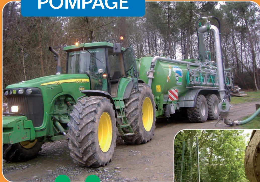
TYPHON 23 Rampe récepteur Ø200